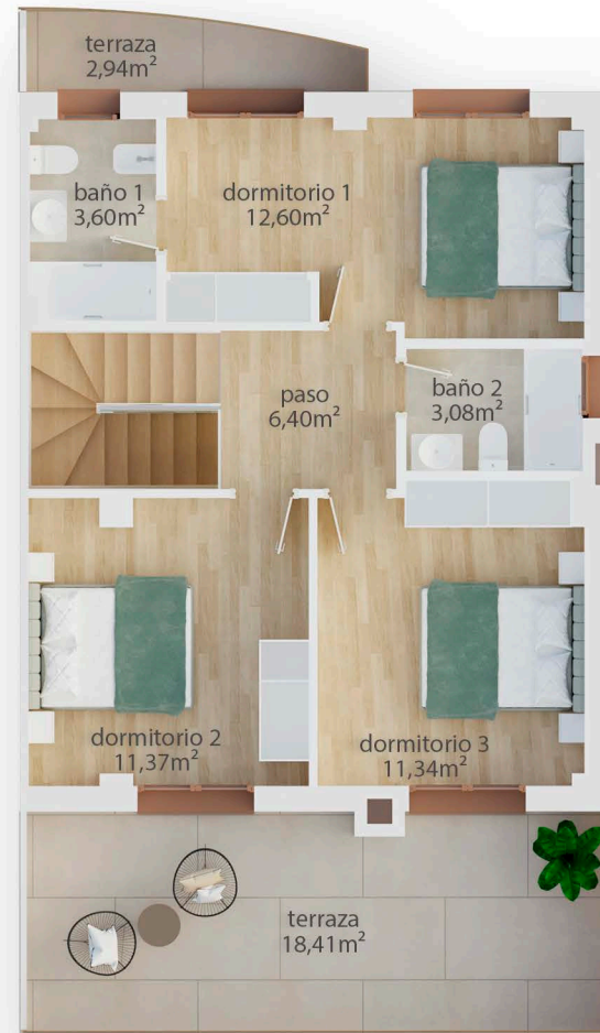
Planta Primera S. Útil: 59,06 m 2 S. Construída: 70,73m 2