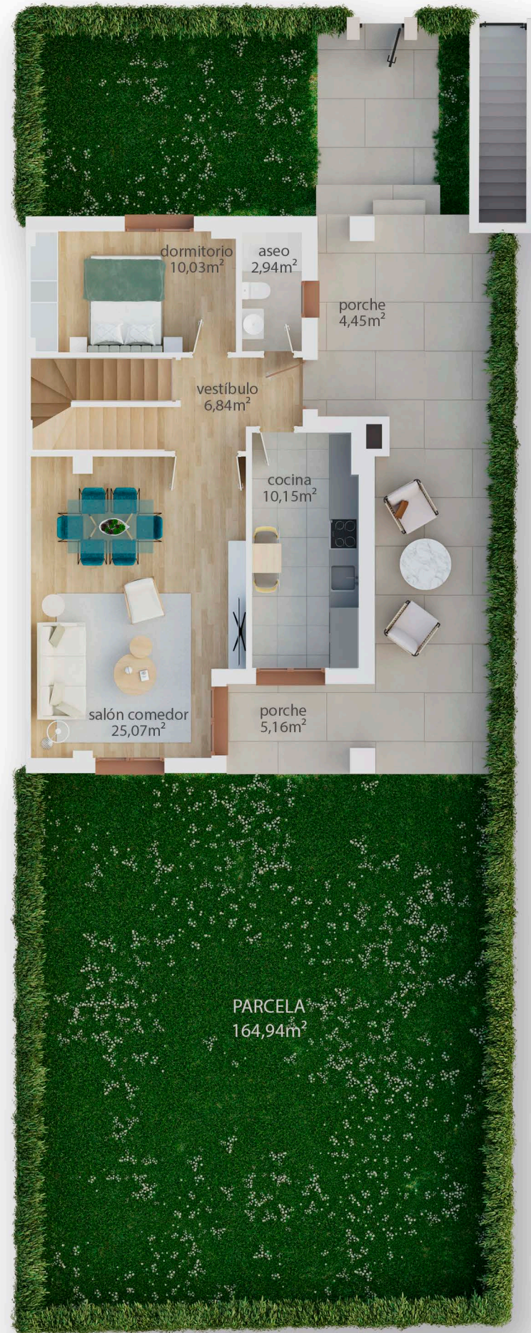
Planta Baja S. Útil: 59,83 m 2 S. Construída: 74,00m 2